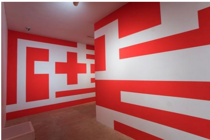
Le immagini di "Opera per l'Ara Pacis. Mimmo Paladino. Musiche di Brian Eno", sono di Ferdinando Scianna/ Magnum/Contrasto.

Inquietudine è creatività artistica in tutte le sue espressioni. Impossibile pensare ad un'opera d'arte prodotta senza un "coinvolgimento appassionato del soggetto che vuole conoscere con l'oggetto del suo interesse".