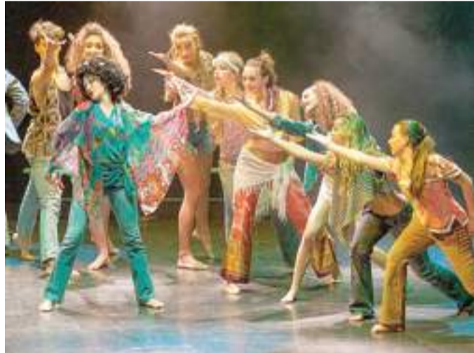
Un momento dello spettacolo del Centro Danza Savona

La serata, a ingresso libero, è in favore dell'Aifo per le popolazioni del Nepal colpite dal terremoto.