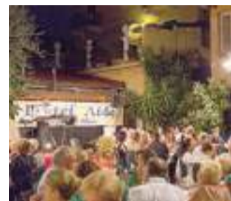
Musica e delizie all'Hotel Aida

Previsto, infatti, un menu d'eccezione che spazia dal pan fritto, abbinato al gustoso e pregiato «salame di Varzi», alla paella preparata dal vivo, una degustazione di formaggi del lodigiano, tra cui il Panterone, presidio Slow Food e unico for-