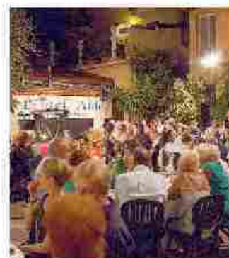
Musica e delizie all'Hotel Aida

Previsto, infatti, un menu d'eccezione che spazia dal pan fritto, abbinato al gustoso e pregiato «salame di Varzi», alla paella preparata dal vivo, una degustazione di formaggi del lodigiano, tra cui il Panterone, presidio Slow Fo-