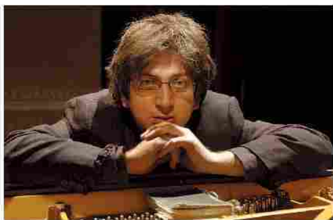
Ramin Bahrami è l'Inquieto dell'Anno

La Festa dell'Inquietudine di Finale Ligure premia oggi il pianista Ramin Bahrami, dal 1987 profugo dall'Iran (Paese in cui morì il padre, rinchiuso in carcere per ragioni politiche) e stimato tra i massimi interpreti di Johann Sebastian Bach e delle sue «Fughe», e l'Isola di Lampedusa, avamposto di migranti fuggiti dai loro paesi. Ad unire Bahrami a Lampedusa è il concetto di fuga, tema dell'edizione di quest'anno della Festa. Bahrami riceverà il premio «Inquieto dell'Anno», riconoscimento assegnato a personaggi che «si contraddistinguono per il loro essere inquieti, cioè vivaci intellettualmente e sentimentalmente». La cerimonia è in programma alle 15 all'Auditorium di Santa Caterina. Ad intervistarlo sa-