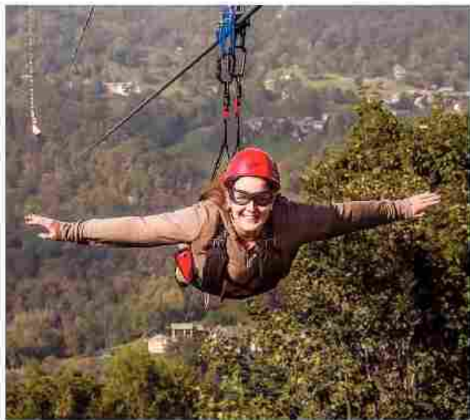
Apra oggi l'impianto Arcansel a Frassinetto

Si decolla dalla stazione della frazione Berchiotto a 1300 mt e si atterra in località Pradas, nei pressi del centro sportivo comunale a quota 1040 mt. Si vola indossando un'apposita imbracatura collegata ad un carrello che scorre sulla fune d'acciaio: un volo totalmente naturale e in totale sicurezza grazie ad un sistema frenante auto-