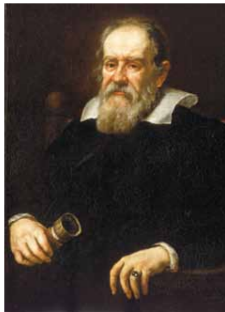
Justus Sustermans, Galileo Galilei, 1636

Le neuroscienze si sono imposte nel dibattito contemporaneo sull'umano come una vera e propria rivoluzione culturale. Esse trovano nella possibilità di accedere, mediante le tecniche quantitative ed oggettive delle scienze, a ciò che accade nel cervello dichiarando conseguentemente di propria pertinenza problematiche tradizionalmente attinenti ad altre discipline come la filosofia, la psicologia e la psicanalisi e, in un certo modo, anche la teologia 1 . Viene così estesa alla realtà dell'uomo la prospettiva che la rivoluzione scientifica galileiana ha applicato alla natura. Non a caso il ricorso alla risonanza magnetico-funzionale, mediante il quale le neuroscienze applicano il metodo sperimentale al cervello umano e alle