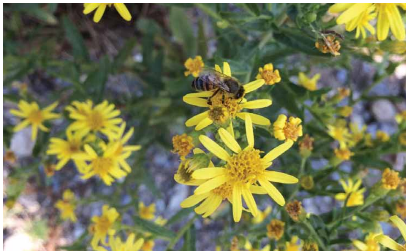
Ape che bottina su un fiore di Ditrichia viscosa