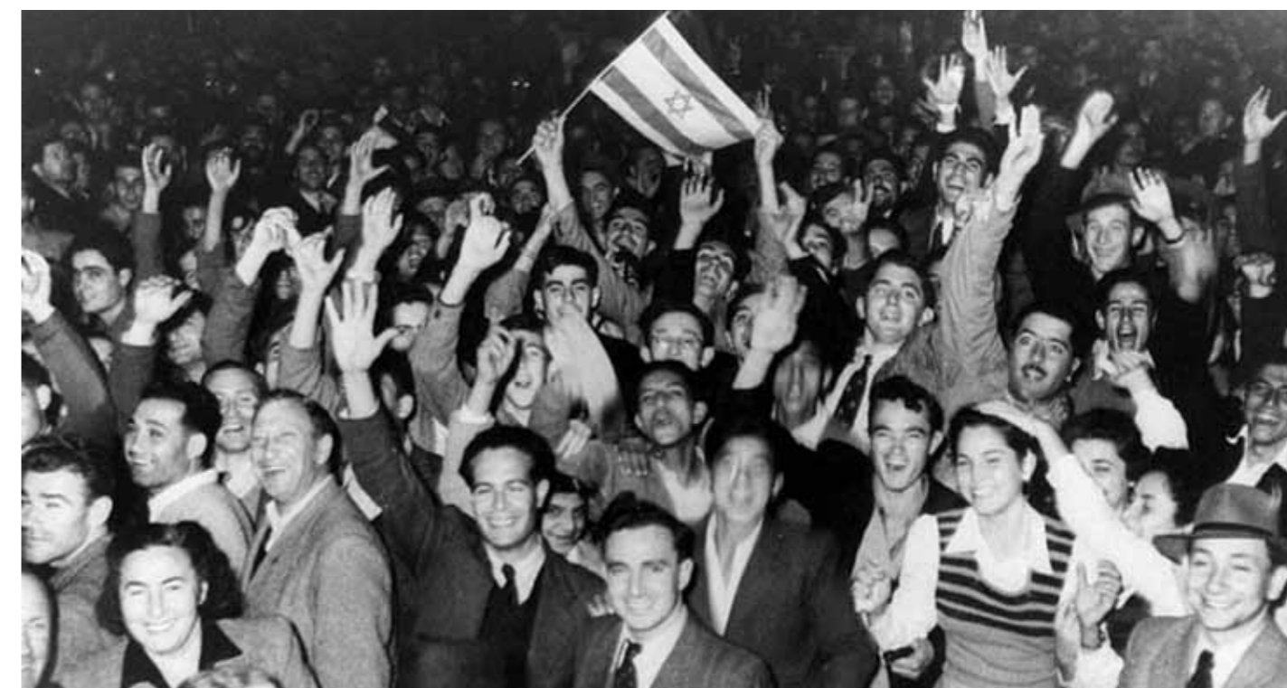
Nascita dello stato di Israele.