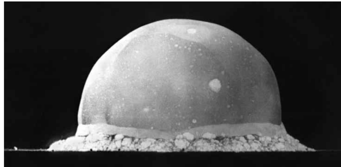
L'antropocene ha inizio con l'era nucleare.