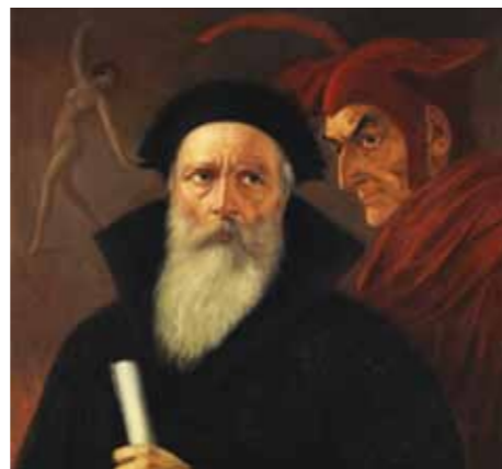
Anton Kaulbach, Il dottor Faust e Mefistofele.

L'interpretazione della terra come nostra interiorità è plausibile, anche perché Uomo ha tratto il suo nome da Humus, terra appunto. Una lettura di questo genere può essere effettuata anche nella grande letteratura come in Dostoevskij nelle sue "Memorie dal sottosuolo", da dove si prepara la rivolta, o per il celebre